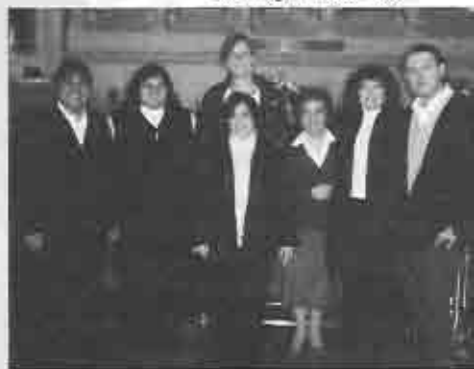
Los integrantes del coro