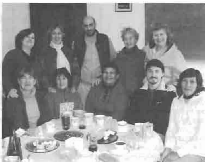
Equipo de trabajo de Acción Social celebrando el Día del Amigo